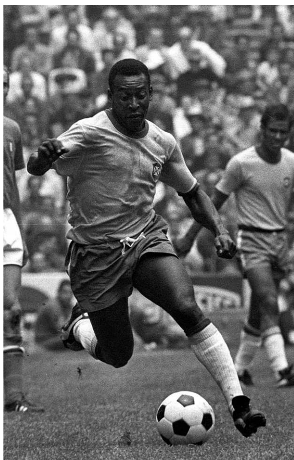
Le « roi » Pelé

Pour échapper aux insultes et aux coups, certains joueurs décident donc se travestir. Carlos Alberto s'enduit le visage de poudre de riz, Arthur Friedenreich surnommé « Le tigre », la première légende du football brésilien, lisse ses cheveux crépus de brillantine. C'est à ce même moment que naît le dribble. Pour ces joueurs, l'esquive est une façon d'éviter les charges rarement sanctionnées des adversaires blancs et les insultes des supporters. Le dribble est une ruse, une technique de survie. On dribble pour sauver sa peau. Le beau jeu brésilien est un football multicolore et flamboyant, où les attaquants jouent de la hanche comme des danseurs de samba. C'est un jeu fait de fulgurances et d'improvisations individuelles.