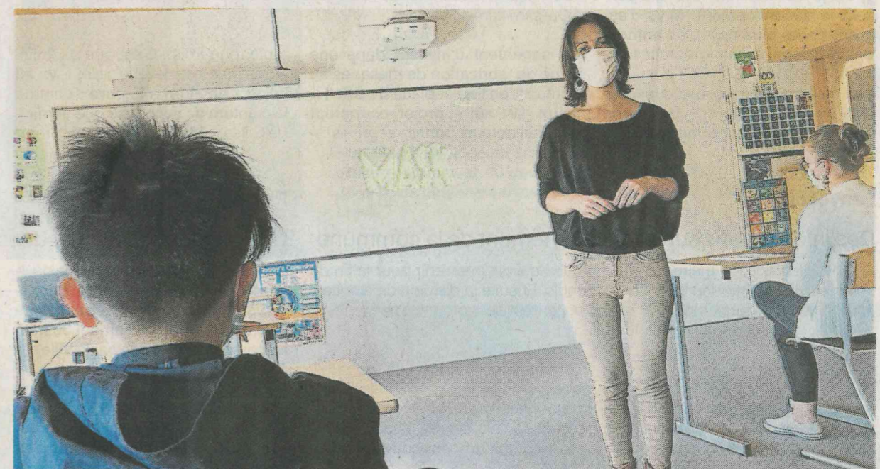
Avant de commencer les cours, professeure et élèves ont fait le point sur les consignes sanitaires.