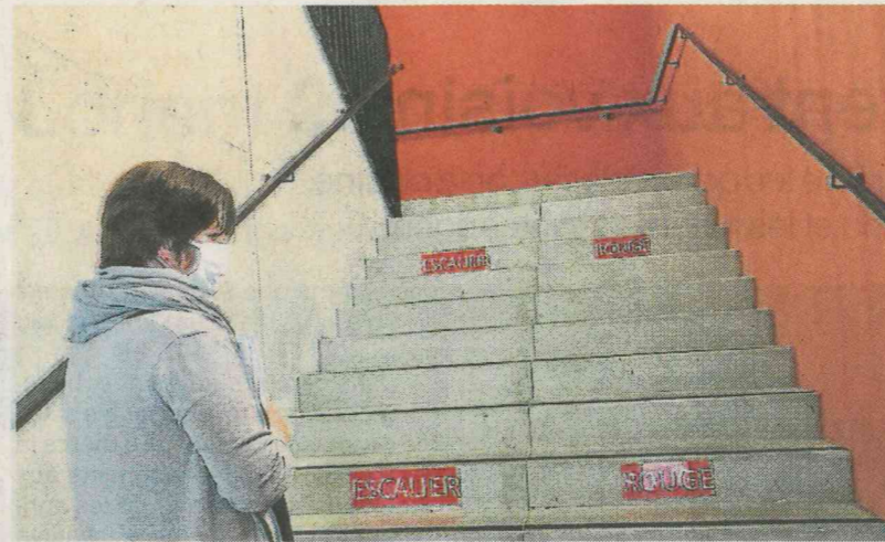
Les élèves ont une couleur de trajet à respecter : rouge, bleu ou vert.