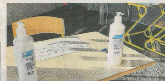
Dans le sas d'entrée, l'arrêt par le « stand » du gel hydroalcoolique est obligatoire.