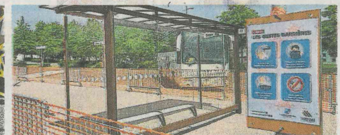
Depuis hier, la gare routière de Lamballe est parée pour recevoir les collégiens.